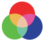
Darstellbares Farbspektrum / Displayable colour spectrum

Mischfarben werden mit der Ansteuerung mehrerer Eingänge gleichzeitig erreicht. / Mixed colours will be achieved with the control of multiple inputs simultaneously.