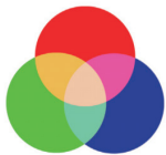
Darstellbares Farbspektrum / Displayable colour spectrum

Mischfarben werden mit der Ansteuerung mehrerer Eingänge gleichzeitig erreicht. / Mixed colours will be achieved with the control of multiple inputs simultaneously.